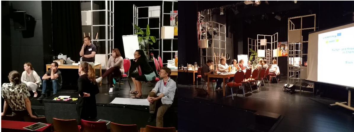
Day 2, Fritz Theatre, Workshop on stage and in scenery